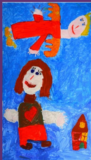
Foto: Rothenburger Bilderbibel zu Lukas 1, 26-38