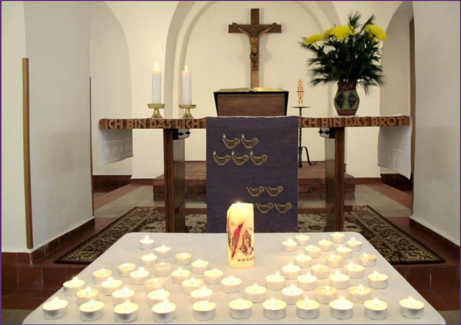
Foto: Kapelle zum Kripplein Christi, Diakonie St. Martin, Martinshof

Diakonie St. Martin Mühlgasse 10 02929 Rothenburg Tel.: 035891 - 38 0 E-Mail: stiftung@diakonie-st-martin.de www.diakonie-st-martin.de