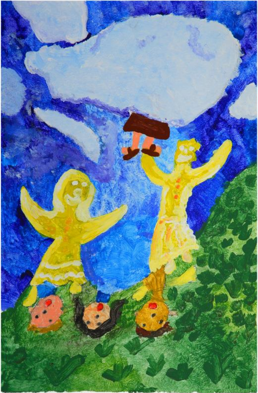
Rothenburger Bilderbibel, Pia Tomat, 9 Jahre